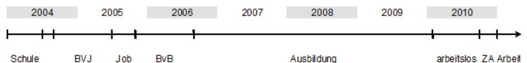
Abbildung 1: zeitliche Darstellung von Omars individuellem Übergangsweg [16]

Omar beendet die Hauptschule mit dem einfachen Hauptschulabschluss im Juni 2004. Nach den Ferien beginnt er im September 2004 ein Berufsvorbereitungsjahr. Im Anschluss jobbt er etwa vier Monate in einer Buchbinderei. Im November 2005 beginnt er ein zweites berufsvorbereitendes Angebot, diesmal eine berufsvorbereitende Bildungsmaßnahme, in deren Rahmen er ein Praktikum in einer KFZ-Werkstatt absolviert. In diesem Praktikumsbetrieb kann Omar im September 2006 eine Ausbildung zum KFZ-Mechatroniker beginnen. Er schließt seine Ausbildung nach dreieinhalb Jahren zu Beginn des Jahres 2010 erfolgreich ab. Im Anschluss ist er ein gutes halbes Jahr arbeitslos, bis er im Oktober 2010 Arbeit über eine Zeitarbeitsfirma (ZA) findet. Nach drei Monaten erhält Omar im Januar 2011 eine Festanstellung. Die unten stehende Grafik (Abbildung 1) illustriert die Stationen von Omars faktischem Übergangsweg in Form eines Zeitstrahls. Die berücksichtigten quantitativen Variablen finden sich in Stichpunkten im Anhang .